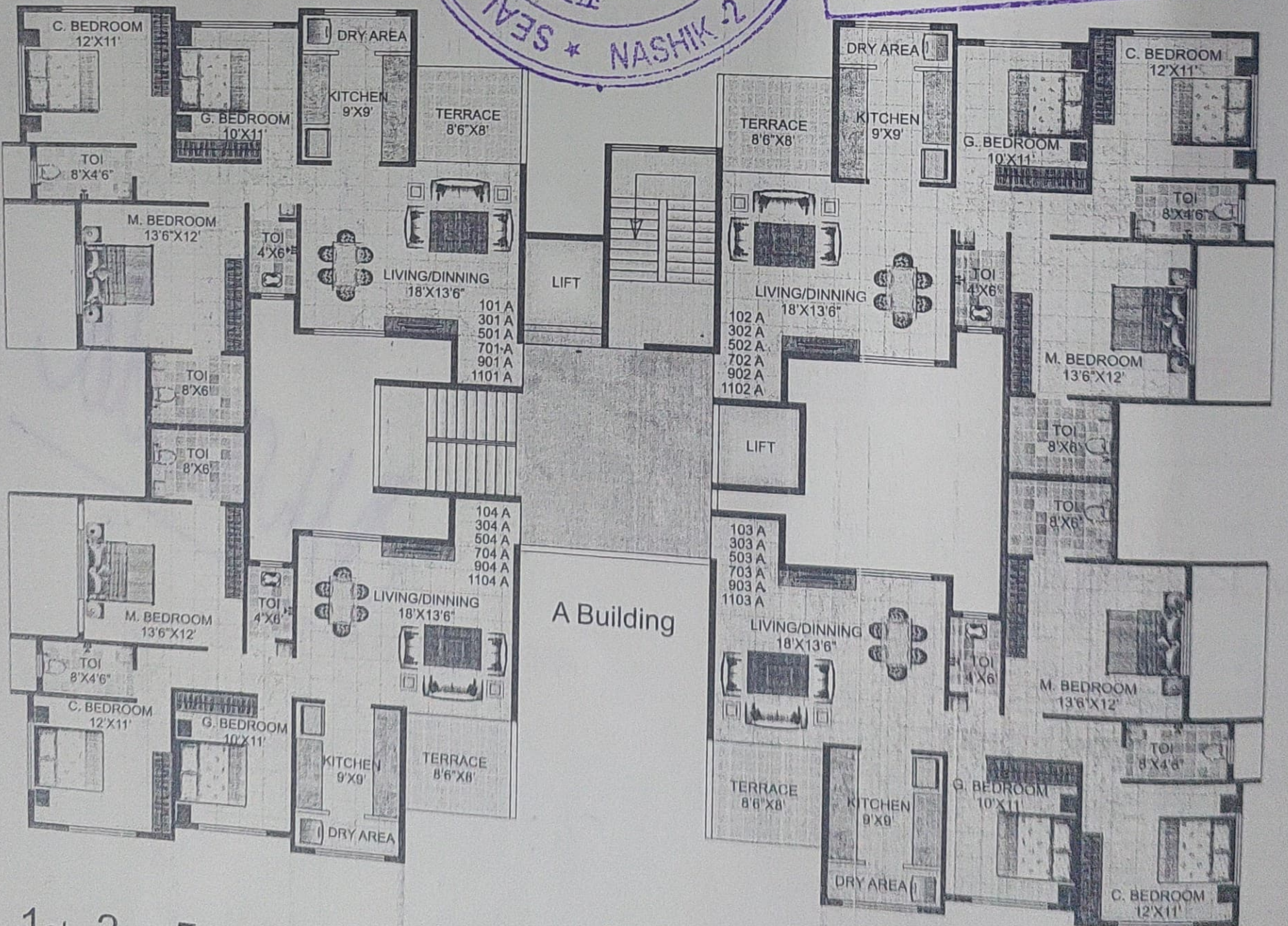
1st, 3rd, 5th, 7th, 9th & 11th floor plan