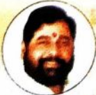
श्री. एकनाथ शिंदे च. मुख्यांणी