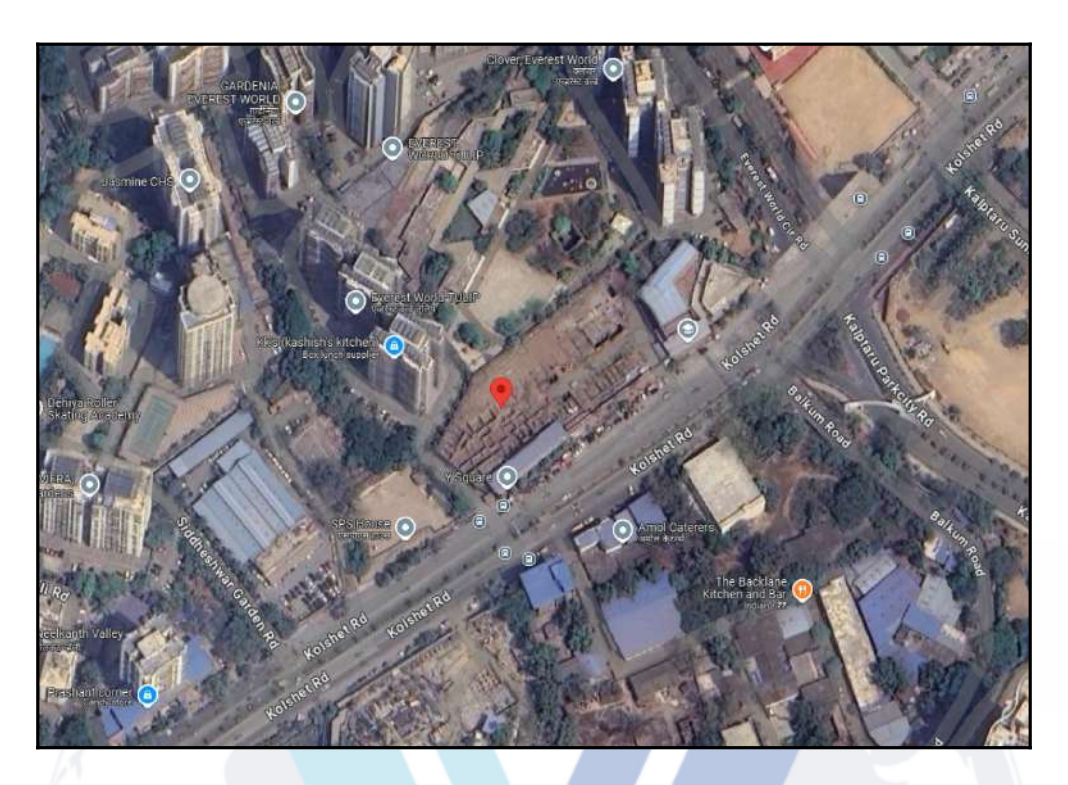
Note: Red marks shows the exact location of the property