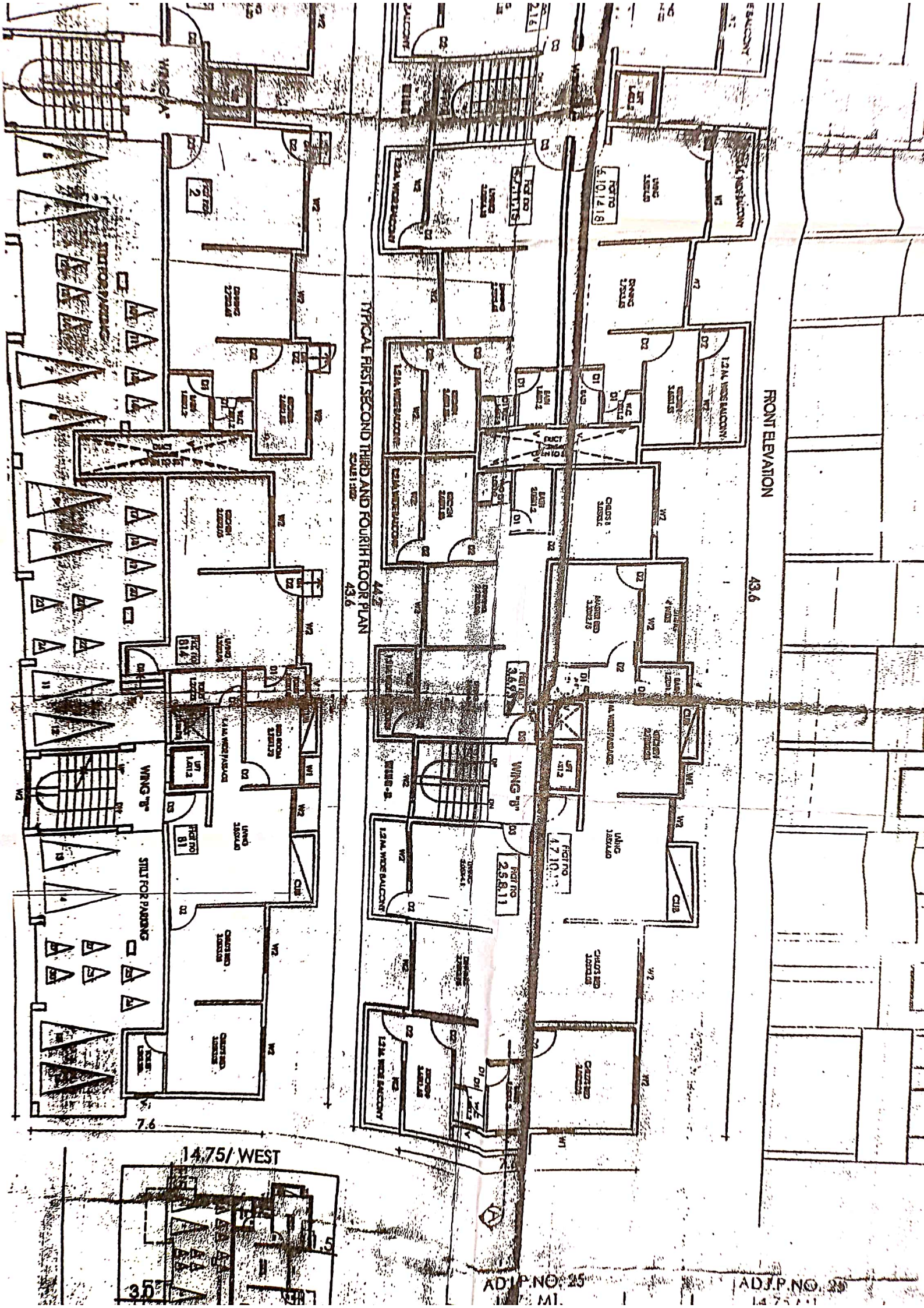
TYPICAL FIRST SECOND THIRD AND FOURTH FLOOR PLAN SCALE 1/8" = 1'-0"