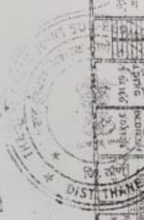
EXTERNAL ROAD 20'0" WIDE TYPICAL FLOOR PLAN SCALE 1:15