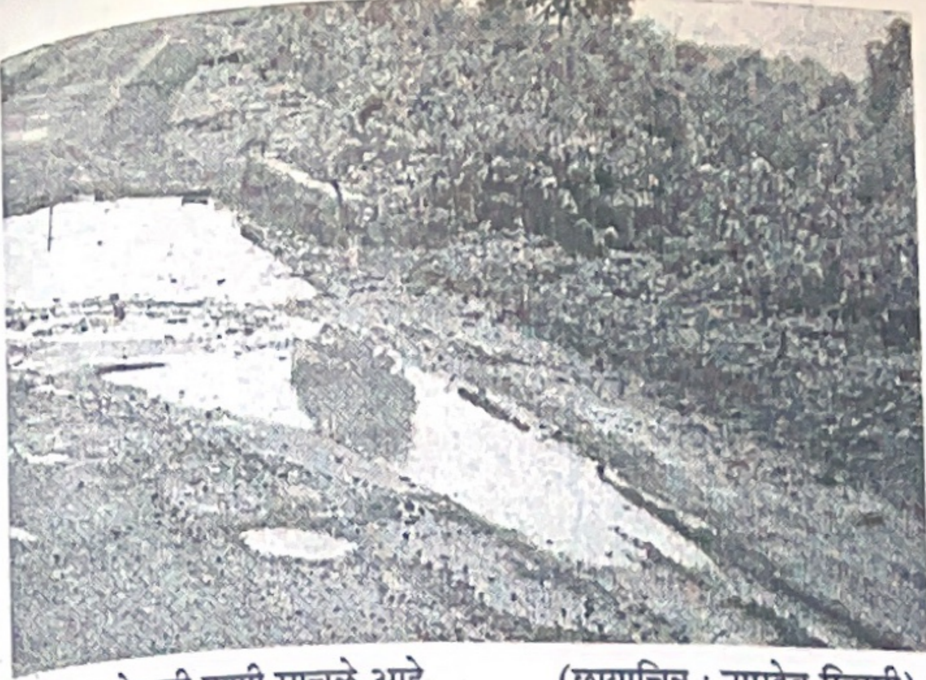
होजन जागोजागी पाणी साचले आहे.